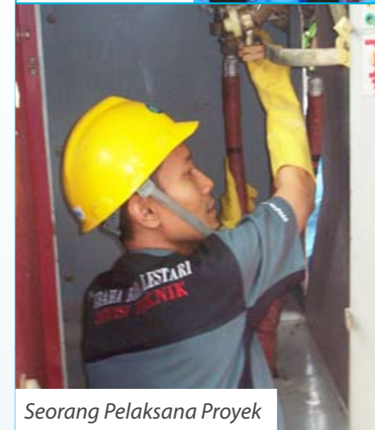
Seorang Pelaksana Proyek