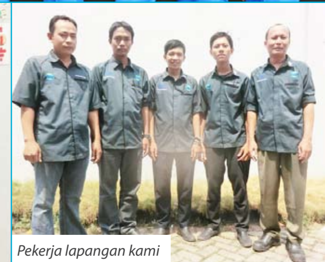
Pekerja lapangan kami