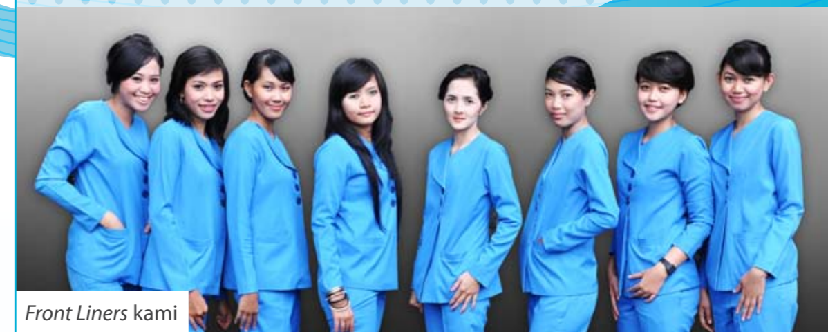
Front Liners kami