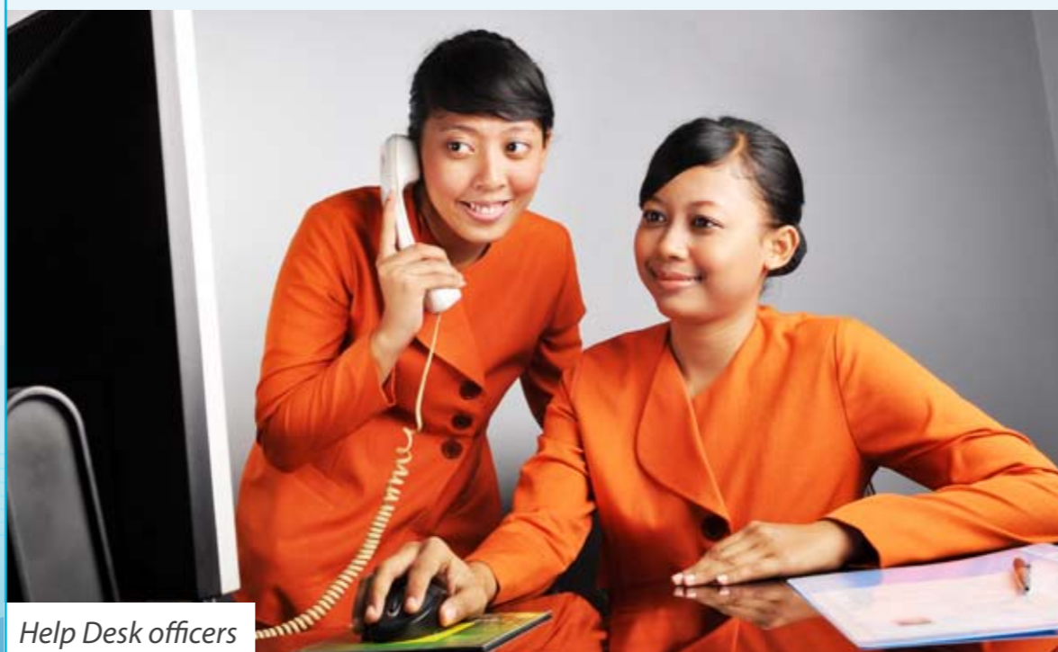
Help Desk officers